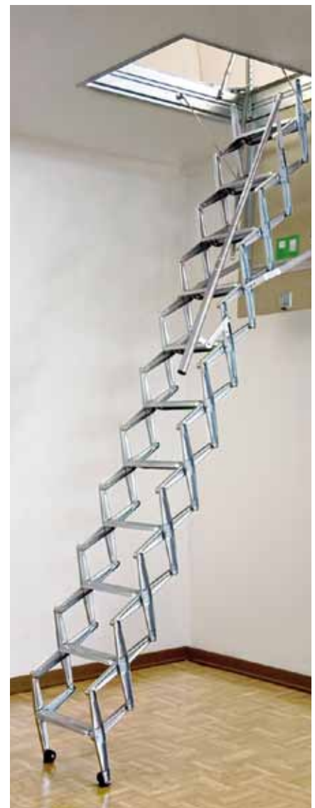
סולם מתקפל סקארי איטליה

בעת תכנון עלית גג יש לקחת בחשבון את החלונות, שמעבר לתפקידם החשוב בהארת החלל, תורמים לאוויר וצינון החדר וכמובן מהווים אלמנט