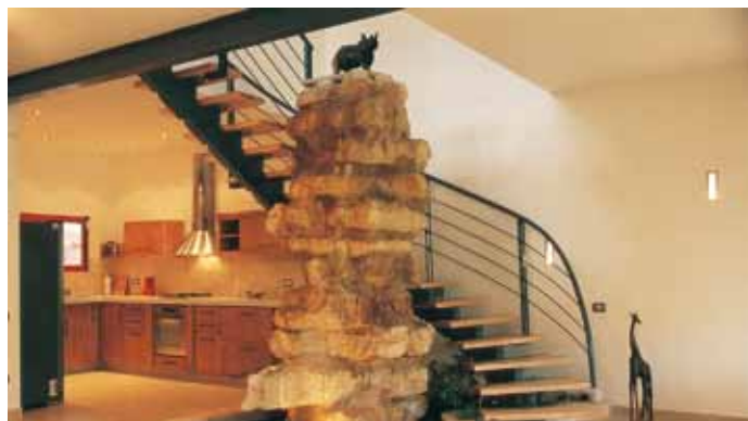
מדרגות סיבוביות דגם ארז

בתכנון. לולייניות "פח מרוג" חיצוניות ליציאות חרום, חנויות, משרדים, חלוקת בתים פרטיים לקומות נפרדות ועוד.