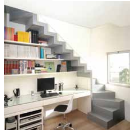
דגם יפעת מפלדה

עיצובי נאה ושימושי המאפשר לצפות בנוף. חברת קב נבון מציגה חלונות המיובאים מאיטליה ודנמרק (velux), ומיועדים לגגות הבנויים בזווית שבין 20-80 מעלות. החלונות בעלי משקוף פנימי מעץ "אורן קליר" מטופל וצבוע בלכה אקרילית, חוץ החלון עשוי אלומיניום צבוע. ידית פתיחה בעלת 2 מצבי נעילה. נשמי אוורור לויסות אוויר נכנס ויוצא, המונעים היווצרות אדים על הזגוגית הפנימית. לכל חלון יש מערכת מרזבים ומנגנוני איטום נגד חדירת גשם, רטיבות ורוח. זכוכית כפולה בידודית עם גז ביניים, בחלק מהדגמים, המבודדת באופן משמעותי את הפרשי הטמפרטורה בין פנים הבית לחוץ. בנוסף לעיצוב החלון יש להתייחס גם למצב הפתיחה שלו. קיימים שלושה מצבי פתיחה עיקריים: פתיחת "ציר מרכזי" בו החלון נפתח סיבוב מלא סביב צירו. פתיחת "ציר עליון" בו החלון נפתח כלפי חוץ בלבד. ופתיחה "כפולה" המשלב פתיחה מרכזית ועליונה (תמונת חלון עליית גג).