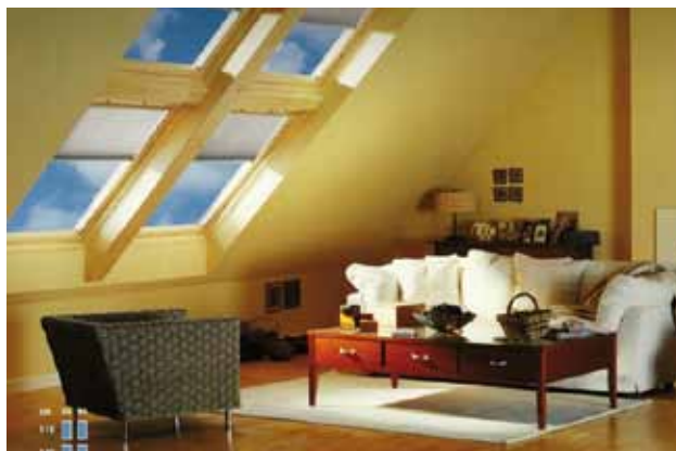
חלונות גג ולוקס דנמרק

אחת המערכות הראשונות שיצר אילן נבון, לפני 36 שנה הייתה מערכת לוליינית. הייתה זו הדמנות נפלאה ללמוד ולהבין מה צריך לעשות ואיך לבנות