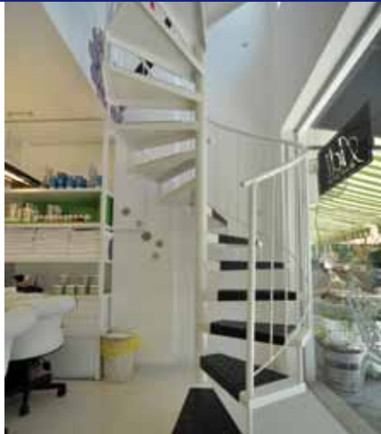
מדרגות לולייניות לפתחים קטנים