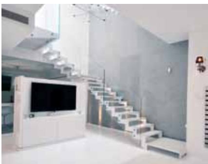
הייטק דק - קב נבון

"גם החלקים בבית שפעם היו אינטגרליים וברורים מאלהים", מסכם נבון, "קיבלו בשנים האחרונות צביון עיצובי רב משמעות. מעבר לבטיחות, החומרים, אמינות החברה המייצרת והפרקטיקה, למראה המדרגות והחלונות חשיבות רבה ואנו כאן בקב נבון , יודעים זאת ומשקיעים רבות בפיתוח משולב של פרקטיקה, נוחות תפעול ועיצוב מרשים".