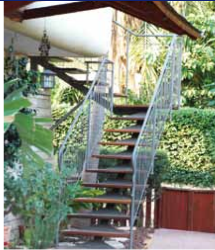
מדרגות חיצוניות בשילוב עץ